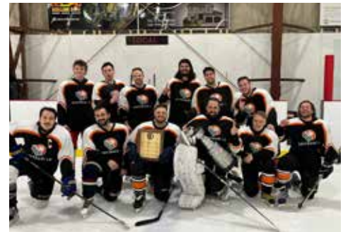
Gagnant classe participative : Coffrage LD