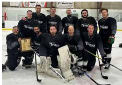
Finaliste classe compétitive : Acier Trimax