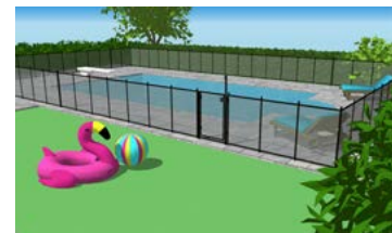
Piscine creusée complètement clôturée.

Autre type d'enceinte de protection. Fournir des plans de l'aménagement.