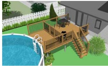
Piscine hors terre avec terrasse munie d'une enceinte de protection.