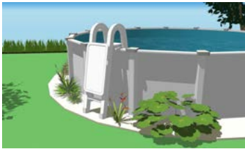
Piscine hors terre avec échelle munie d'une portière de sécurité qui se referme et se verrouille automatiquement.

Veillez sélectionner le type de projet de piscine concerné par votre demande :