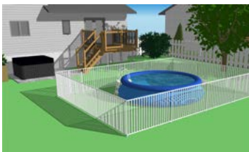
Piscine hors terre (moins de 1,2 mètre de hauteur), gonflable ou à parois souples (démontable) complètement clôturée.