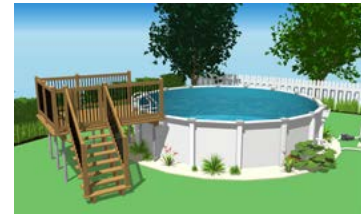
Piscine hors terre avec plateforme munie d'une enceinte de protection.