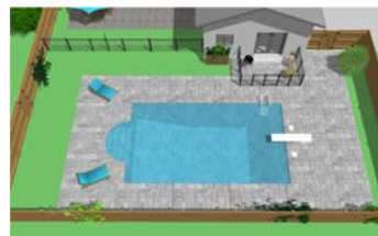
Piscine creusée clôturée avec balcon muni d'une enceinte de protection.